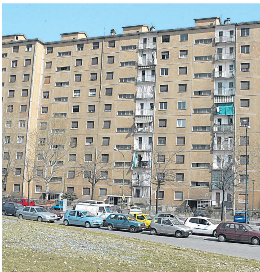
Il palazzo che negli Anni Sessanta fu edificato per assorbire l'urto della Grande Immigrazione

Al posto dei vecchi edifici-simbolo della Torino da boom economico, una nuova, grande piazza centrale con tanto di teatro all'aperto, giochi d'acqua e terrazze verdi. A collegare il futuro fulcro del quartiere con un Parco Colonnetti completamente riqualificato un cavalcavia ciclo-pedonale che s'affaccerà su una via Artom parzialmente ribassata.