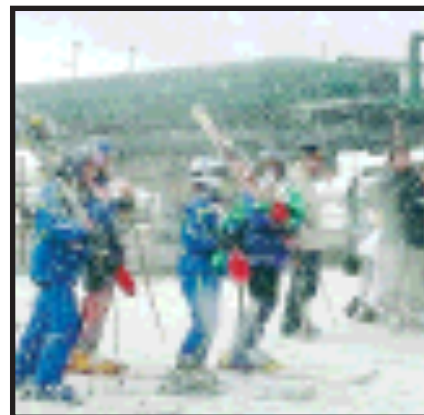
Sestriere, ieri sotto la neve